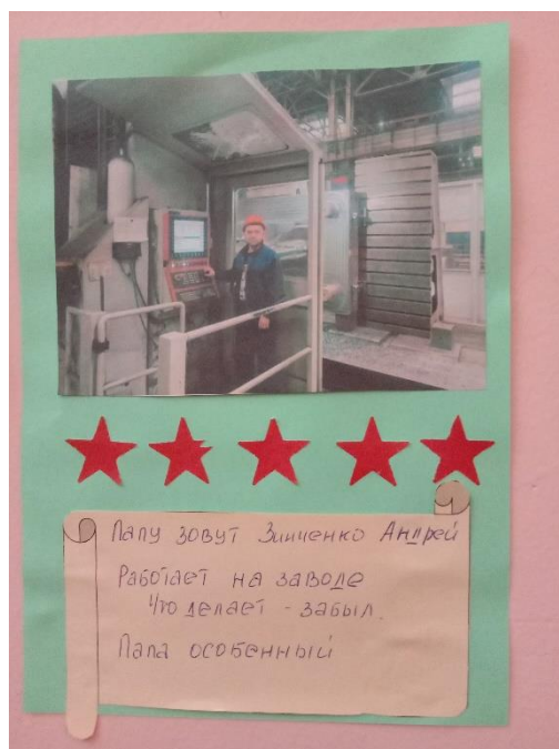
Фото-выставка «Мамы и папы мы гордимся вами»