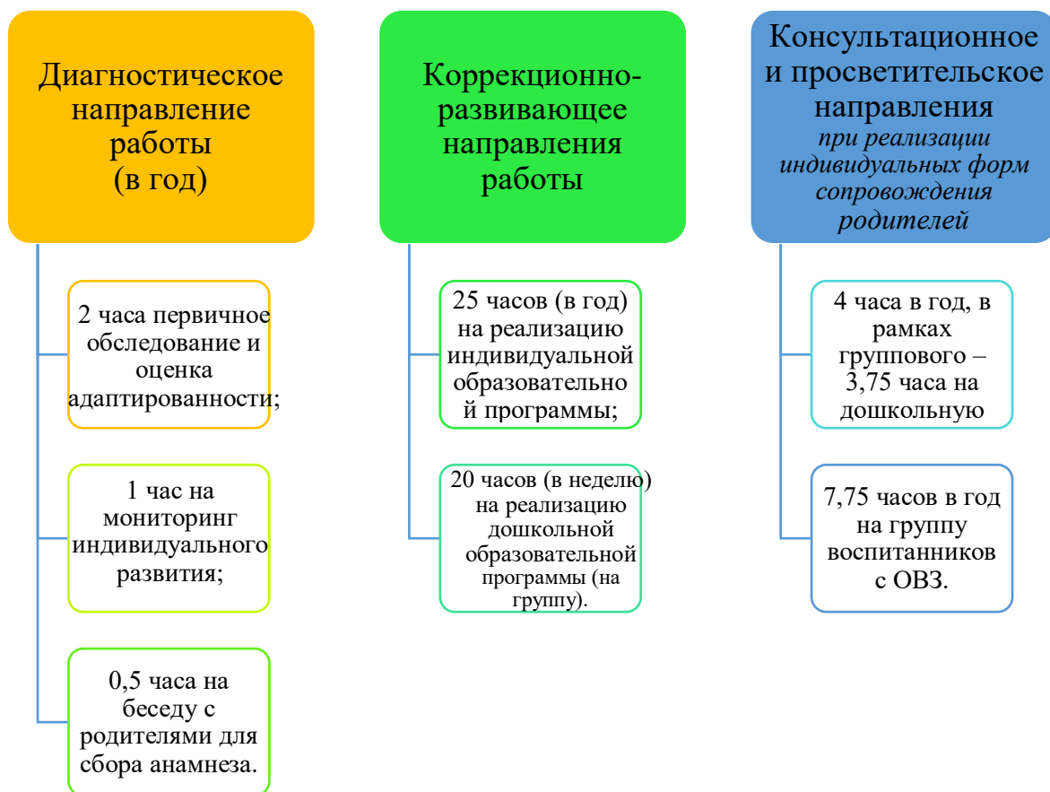
График организации образовательного процесса